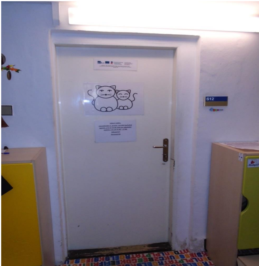
Fotografie č. 16 zahrnuje následující úpravy: