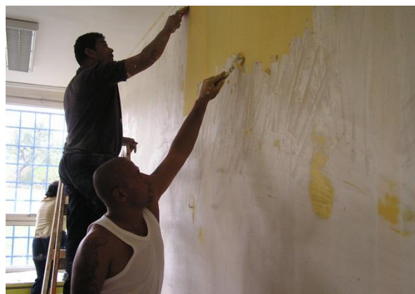
Obyvatelé sídliště, kteří prošli rekvalifikací, mohou být zaměstnáni ve Stavební skupině na drobných opravách

Pod záštitou DRK byla zřízena Stavební skupina, která zaměstnává nejúspěšnější absolventy rekvalifikací. Skupina kromě zakázek komerčního charakteru vykonává ještě práce zaměřené na obnovu a údržbu zařízení a nemovitostí Domu romské kultury nebo na obnovu a údržbu majetku Statutárního města Most.