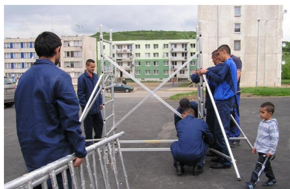
Zaměstnaní účastníci projektu

Díky úspěšnému působení v lokalitě se na DRK obrací i další organizace; spolupráce je upevňována na společných „případových konferencích“. Společná setkání dále pomáhají komplexnímu řešení problematiky cílové skupiny.