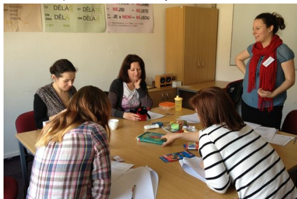
Prohlubující semináře probíhaly v menších skupinkách a interaktivní formou

Doprovodnými aktivitami projektu byly tvorba a distribuce informační brožury (pro nábor CS) a tzv. handoutů (pro výuku i samostudium CS a ostatních cizinců). Dále byly vydány publikace „Jeden rok v nové zemi“ a „Navigace světem práce“ (pro lepší orientaci v nové společnosti).