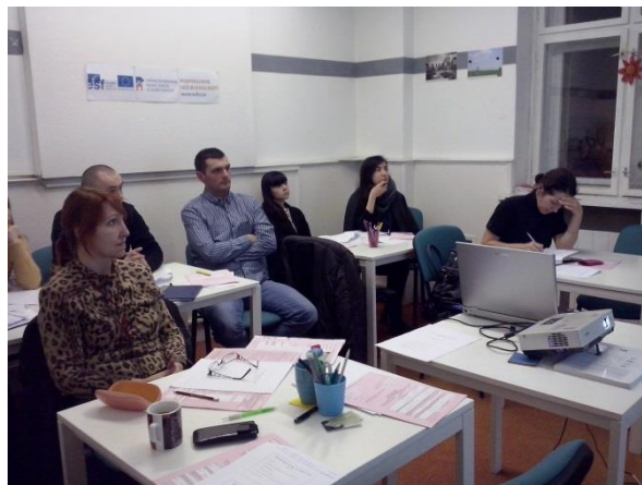
Kurzy byly zaměřeny i na získání dovedností potřebných pro začlenění se na trh práce

Za největší dopad projektu považují účastnice dodání sebevědomí, které jim kvůli pobytu v nové zemi a částečně také kvůli tehdejší mateřské dovolené chybělo. Díky zaměření semináře na osobní rozvoj se podařilo posunout účastnice i v jejich kariéře – dokáží se nyní lépe prosadit, věří si, nebojí se žádat o prestižnější pracovní místa nebo dokonce založit vlastní podnikání. Účastnice se shodují, že „objevily věci, o kterých ani nevěděly, že je dokáží“.