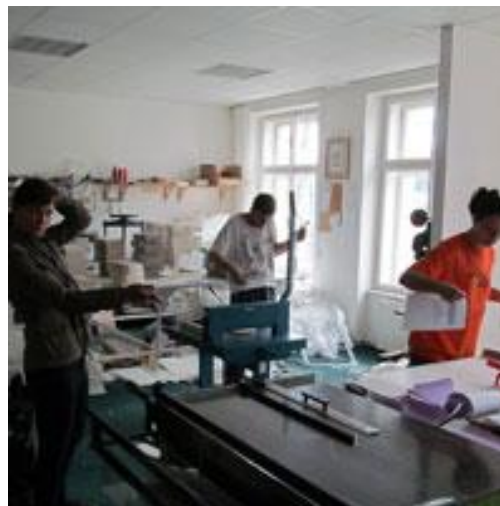
TESSEA poskytuje dlouhodobě podporu českým sociálním podnikatelům při jejich činnosti i spolupráci s dalšími relevantními aktéry.

Dalším cílem projektu bylo vytvořit platformu pro poskytování a sdílení informací o sociálním podnikání v České republice stávajícím provozovatelům sociálních podniků a dále zájemcům o vstup do oblasti sociálního podnikání.