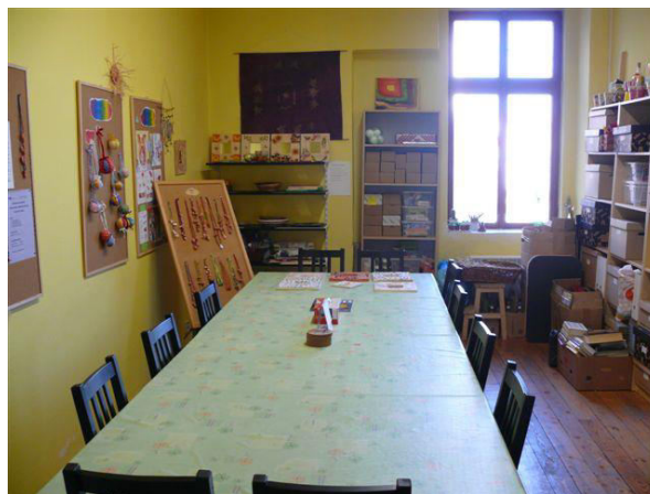
Obr. 2 Ruční dílny jsou součástí aktivizačních služeb

"Při dílnách, kde něco tvoříme, se musím soustředit jenom na tu práci. Nemusím přemýšlet o své nemoci. Přijdu na jiné myšlenky."