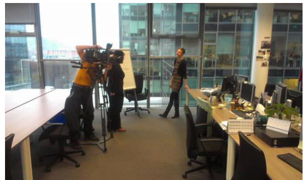
Česká televize natočila reportáž o osobách zaměstnaných v rámci projektu přímo v jejich pracovním prostředí ve firmách. V bankovní společnosti jeden z účastníků třídí faktury.

Zaměstnavatelé díky projektu získali pozitivní zkušenost se zaměstnáváním osob s autismem, kterou mohou šířit dál jako příklad dobré praxe.