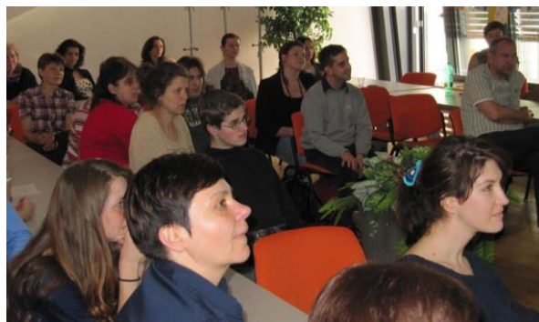
Na závěr projektu proběhl diskusní seminář, kde se svými příspěvky vystoupili zástupci zaměstnavatelů, rodiče, ale také pracovníci speciálně pedagogického centra a úřadu práce.

Všechny aktivity přitom byly prováděny výhradně individuálně vzhledem ke komunikačním a sociálním bariérám osob s autismem. Účastníky tak při všech aktivitách i při docházení do zaměstnání doprovázeli osobní asistenti.