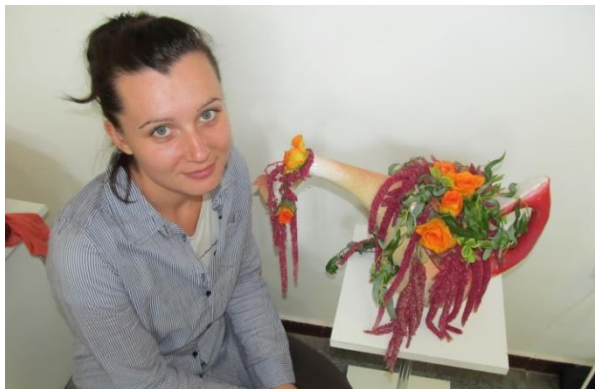
Jedním z kurzů, které účastnice absolvovaly, byla také floristika. Mezi další patřily administrativní pracovníce, obsluha vysokozdvížeňého vozíku či účetní.