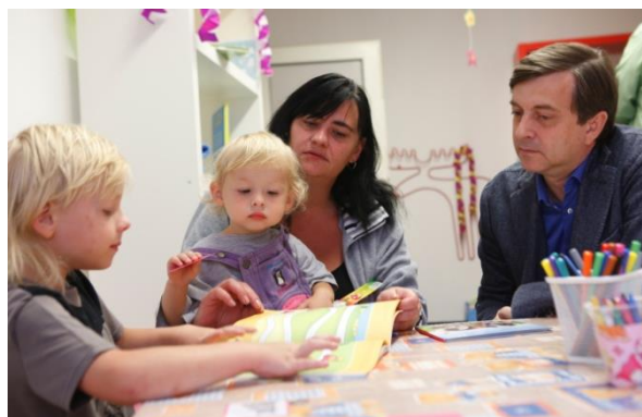
Po dobu realizace projektu byly zřízeny mateřské školy v Ostravě a Karviné a „mikroškola“ pro děti do 3 let v Opavě.

Průběh a výsledky projektu byly shrnuty ve filmovém dokumentu, který slouží pro šíření dobré praxe projektu.