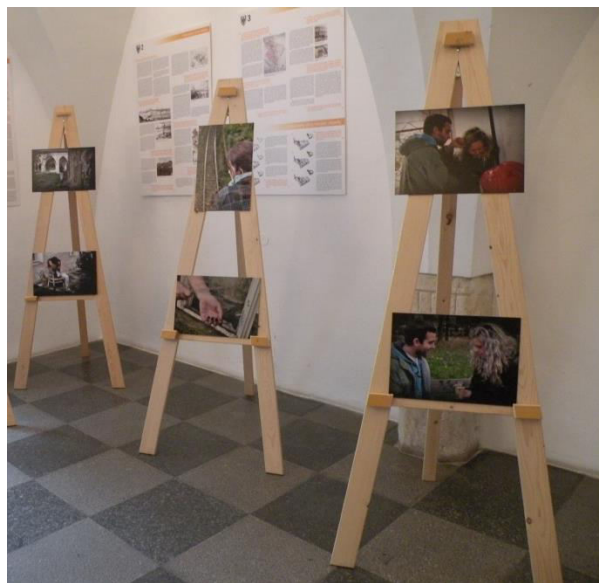
Putovní výstava fotografií upozorňující na problematiku domácího násilí, která byla vystavena na radnici města i ve školách v kraji.

Díky realizaci projektu a praxi s poskytováním komplexních služeb zahájil také příjemce realizaci dalšího návazného projektu, který je financován z Norských fondů. Na projekt navazovaly další aktivity jako výstava fotografií k tématu domácího násilí. Výstava se stala putovní a problematika domácího násilí se díky ní dostává do širšího povědomí veřejnosti.