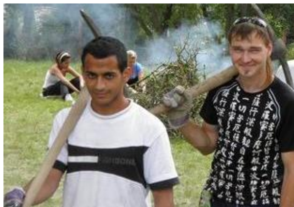
Zaměstnání je klíčovou oblastí pro řešení situace obyvatel sociálně vyloučených lokalit.