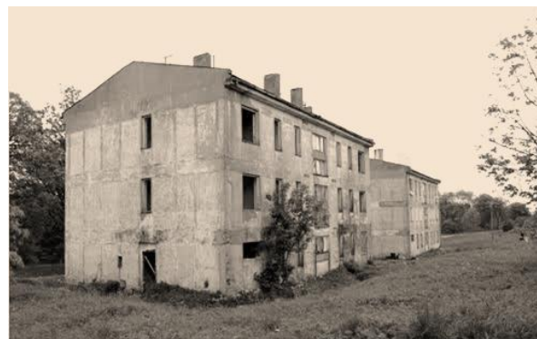
Ukázka sociálně vyloučené lokality v obci Štítary na Chebsku. Poskytovatelé sociálních služeb dojíždějí i do špatně dostupných oblastí kraje, jejichž obyvatelé bývají zejména v zimním období odříznuti od běžných veřejných služeb.

V rámci projektu byla dále rozvíjena multidisciplinární spolupráce, tj. došlo k zlepšení vzájemné komunikace mezi aktéry působícími v oblasti sociálního začleňování, jako jsou obecní úřady, další sociální služby, policie, ale také školská či zdravotnická zařízení.