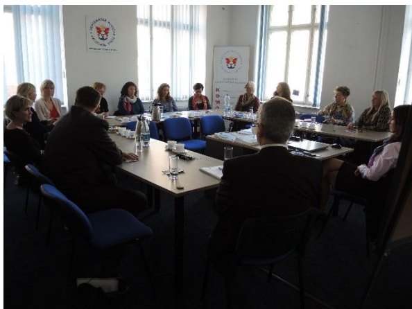
Součástí projektu byly i workshopy a semináře pro další relevantní aktéry, na kterých byly prezentovány výstupy projektu a příklady dobré praxe u účastnic projektu.

Výstupy projektu v podobě publikací a případových studií dobré praxe byly poté šířeny na workshopech a seminářích pro relevantní aktéry.