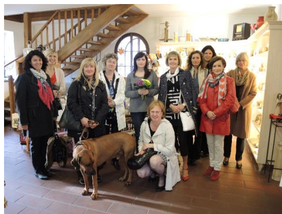
Exkurze u jedné z německých podnikatelek.

Realizační tým dále vytvořil Příručku aktivit podporujících motivaci k sebezaměstnávání představující českým ženám zvažujícím podnikání motivaci a inspirativní příběhy německých podnikatelek. Zároveň zde bylo podrobněji rozebráno potenciální řešení překážek pro zahájení podnikání a nástroje používané tamními organizacemi.